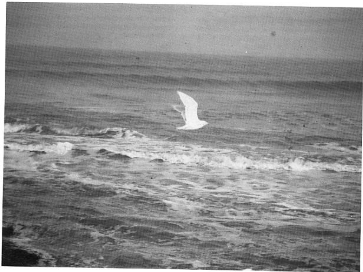
Grote Burgemeester ( Larus hyperboreus ). Blankenberge, 1979.