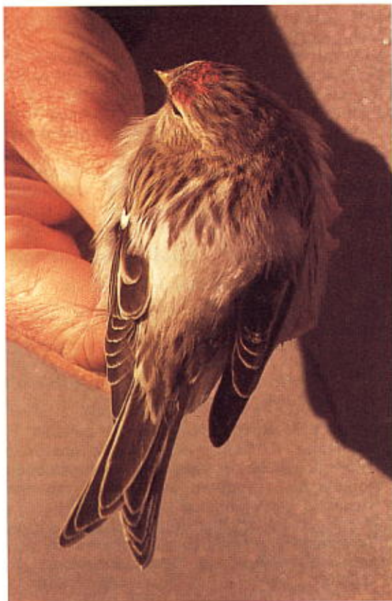
Europese Witstuitbarmsijs, Carduelis hornemanni exillipes , 1ste jaars ♂. Heverlee, 22 november 1975.

1975: v 22 november Heverlee 1 ex. (vogel A) ( Wielewaal 43: 137 en M. Herremans); determinatie bevestigd door L. Svensson ( in litt. 1980), Nieuwe ondersoort voor België.