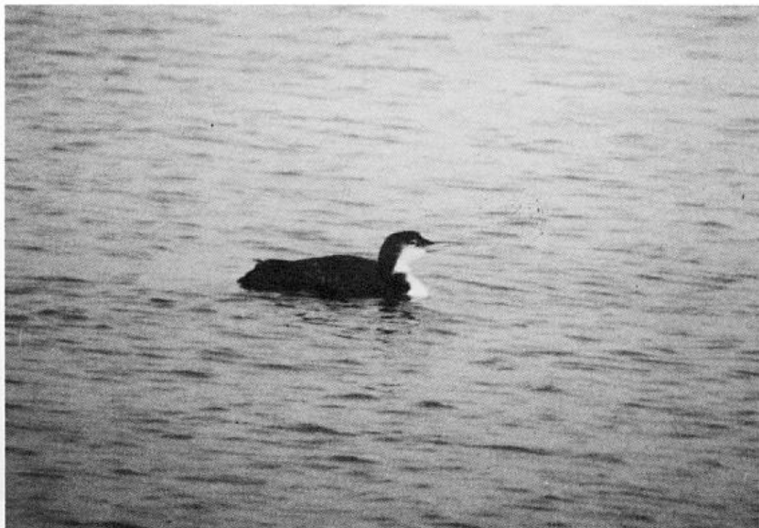
IJsduiker Gavia immer adult, Heist (W) 16 november 1985