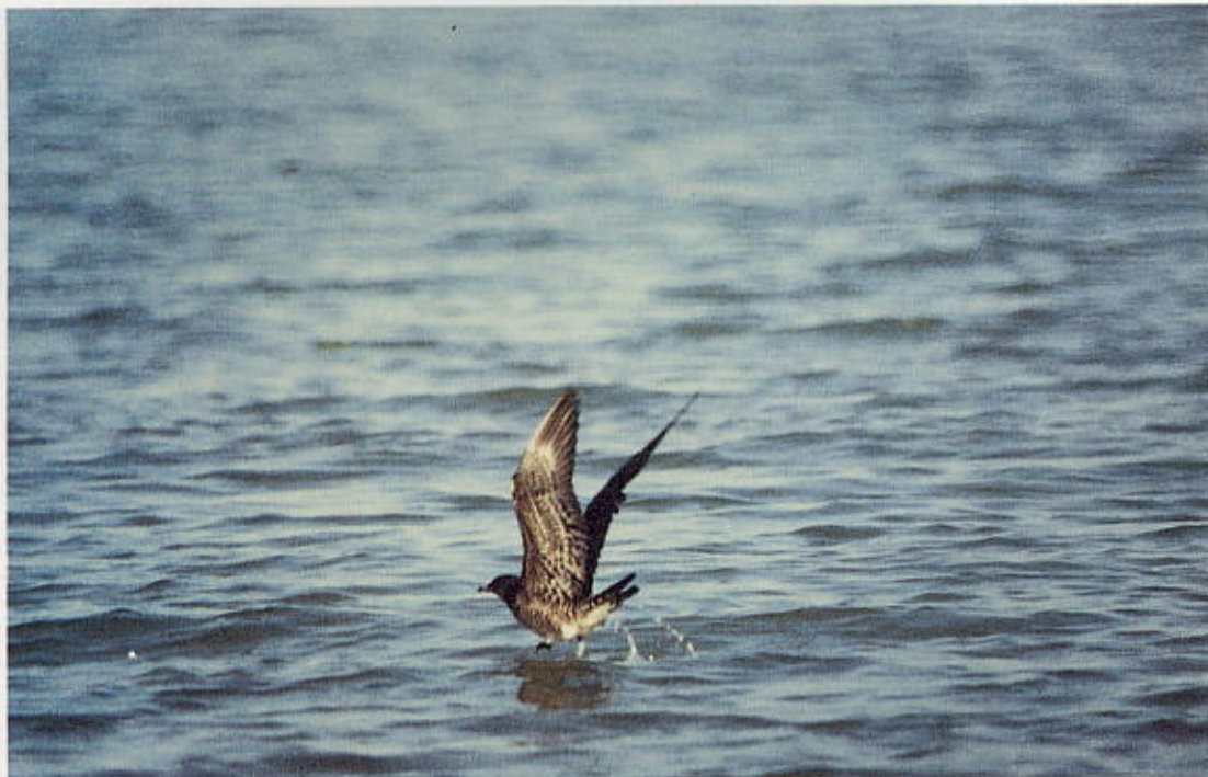
Kleinste Jager Stercorarius longicaudus juveniel donker type in vlucht, Zeebrugge (W) 12 oktober 1985