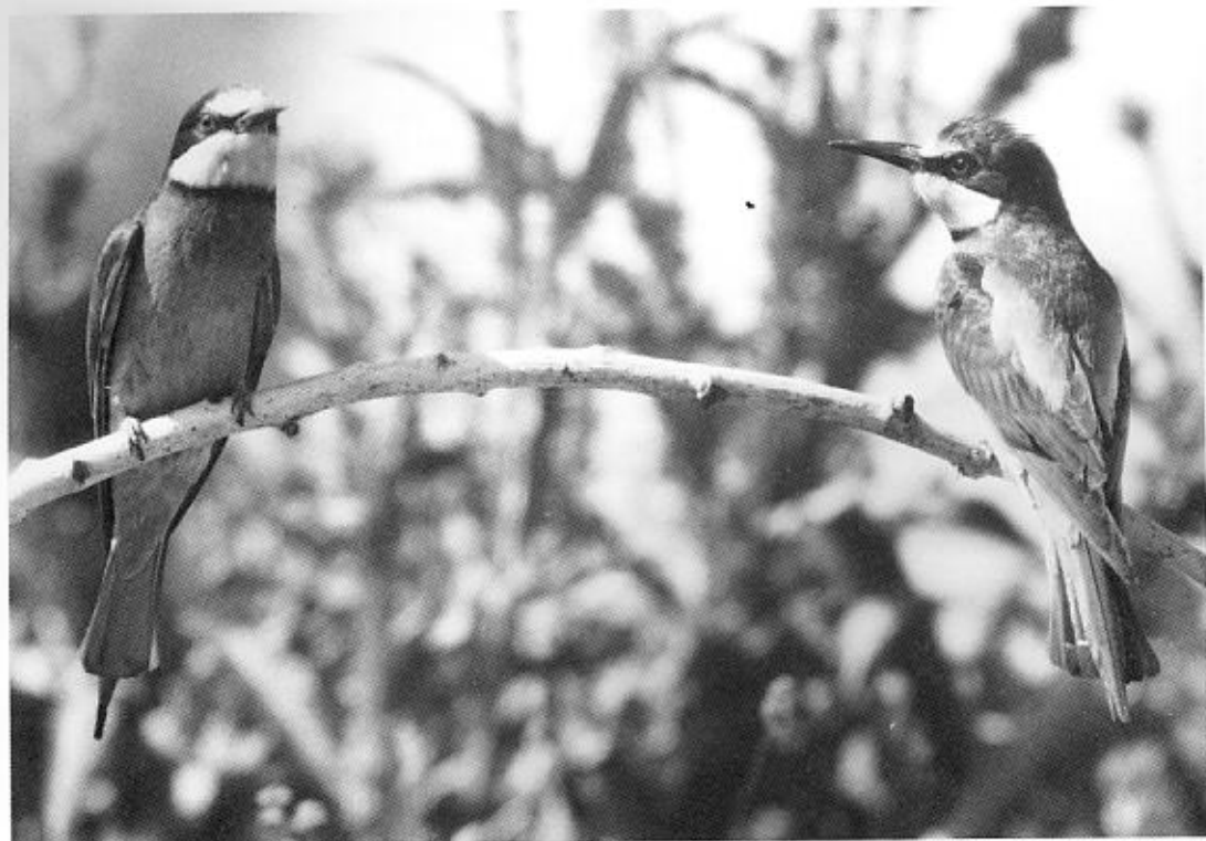
Bijeneter Merops apiaster , Noord-Spanje, juni 1987