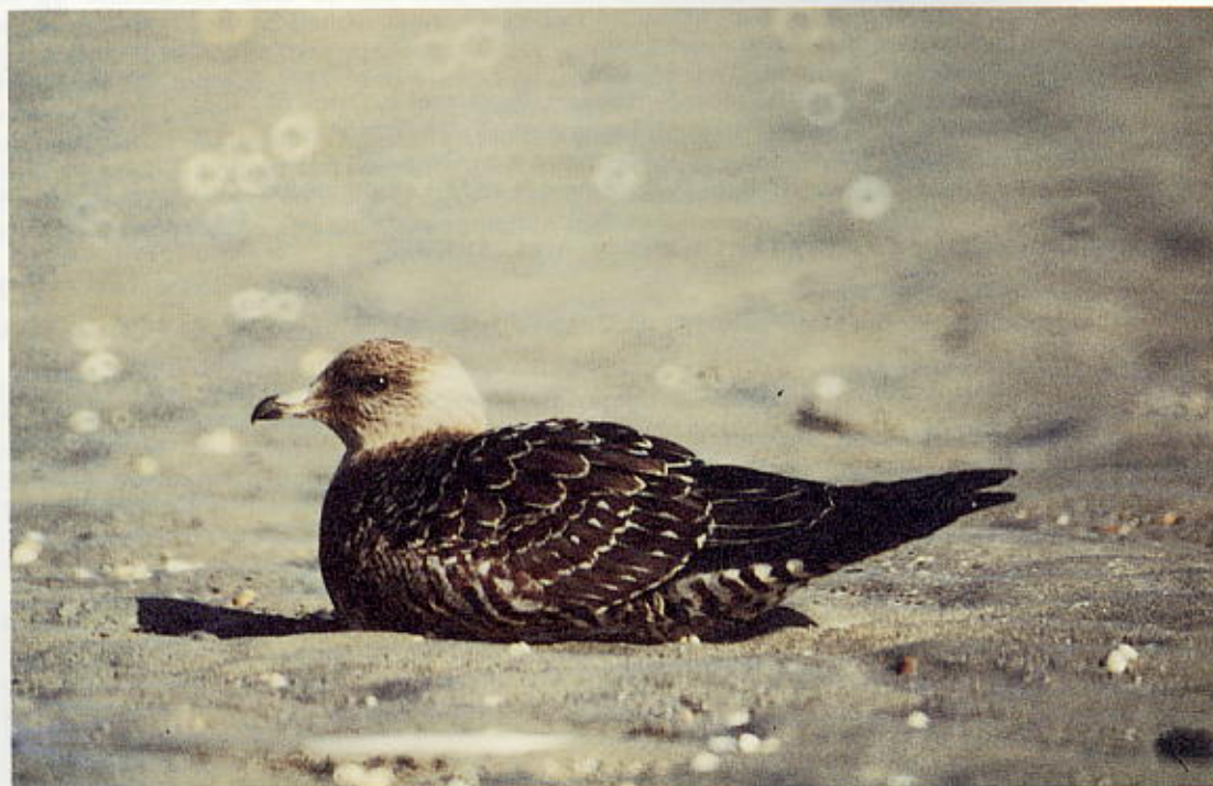
Kleinste Jager Stercorarius longicaudus juveniel "café au lait"-type, Zeebrugge (W) 6 oktober 1985