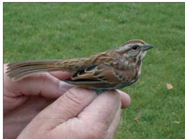
Zanggor Melospiza melodia , Sint-Laureins, 30 sep 2004