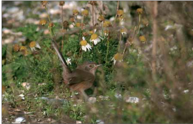
Provençaalse Grasmus Sylvia undata , Zeebrugge, 7 okt 2004

Twee oktoberwaarnemingen werden nog niet ingediend.