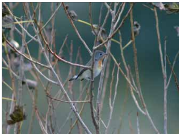
Kleine Vliegenvanger Ficedula parva , Oostende, 29 sep 2004

(22) 6 maart, De Haan (W): 1 ad. m. gevangen en geringd (Schepens P.; ringnummer 8487670). Ondersoort onbepaald. Met een vleugellengte van 80mm was deze vogel aan de grotere kant voor exillipes ; de lichtbruine tint op kop en mantel past dan weer niet goed op een adult mannetje hornemanni .