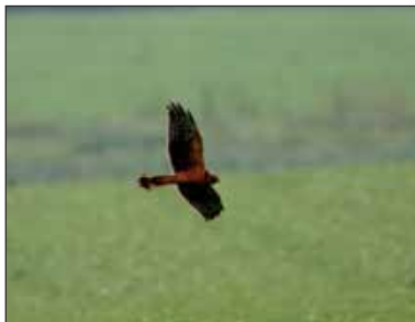
Steppekiekendief Circus macrourus , Thuillies, 4 nov 2004

- 23 december, Grand-Leez (N), étangs du Long-Pont: 1 juv. (Grégoire D.; CH)