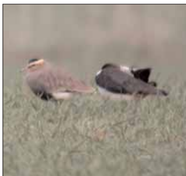
Steppekievit Vanellus gregarius , Mehaigne, 23 maa 2004

zomer (Van Audenhove E., Vanwynsberghe J. e.a.) (118-119) 15 mei, Gent (O), Bourgoyen: 2 ex. (Spanoghe G.)