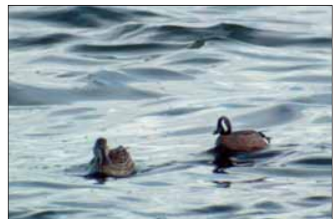
Blauwvleugeltaling Anas discors , Woumen, 7 apr 2004

Een januariwaarneming uit de provincie Oost-Vlaanderen is nog in circulatie en een exemplaar uit West-Vlaanderen in januari werd nog niet ingediend.