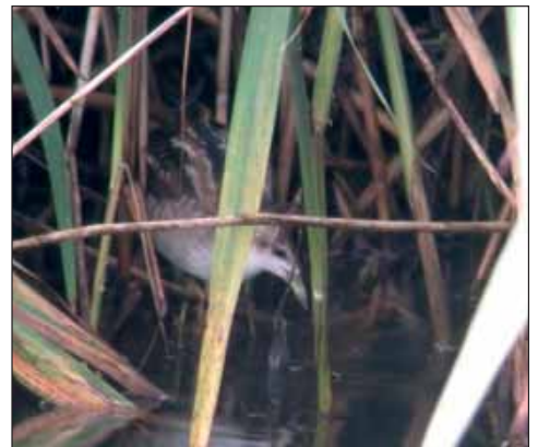
Klein Waterhoen Porzana parva , Hollogne-sur-Geer, 28 aug 2004

(35) 26 augustus - 1 september, Hollogne-sur-Geer (Lg): 1 juv. (Farinelle C., Ameels M.; CH; f Legrand V. Dutch B. 26/5(2004):354, pl. 509)