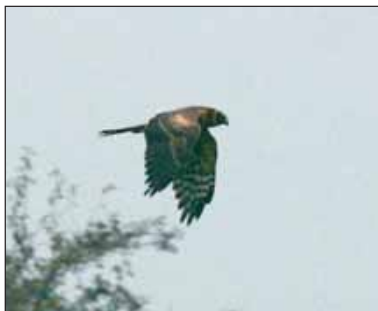
Steppekiekendief Circus macrourus , Thuillies, 4 nov 2004