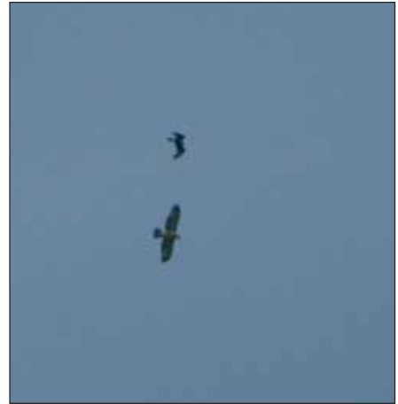
Havikarend Hieraaetus fasciatus , Zandvoorde, 26 apr 2004 (bewijsfoto)

Maar liefst 11 waarnemingen werden nog niet ingediend. Ruigpootbuizerd is een zeldzame soort geworden in België; als er in 2004 inderdaad 15 gevallen waren, is het de moeite dit te documenteren.