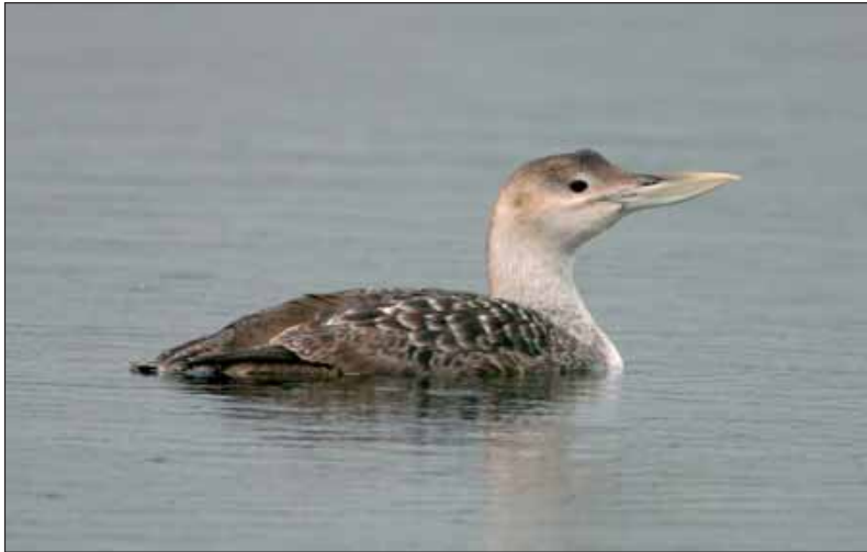
Geelsnavelduiker Gavia adamsii , Duffel, 18 apr 2004

Waarschijnlijk dezelfde vogel (?) werd op 15 mei langsvliegend gezien op dezelfde plaats, maar deze waarneming werd (nog) niet ingediend.