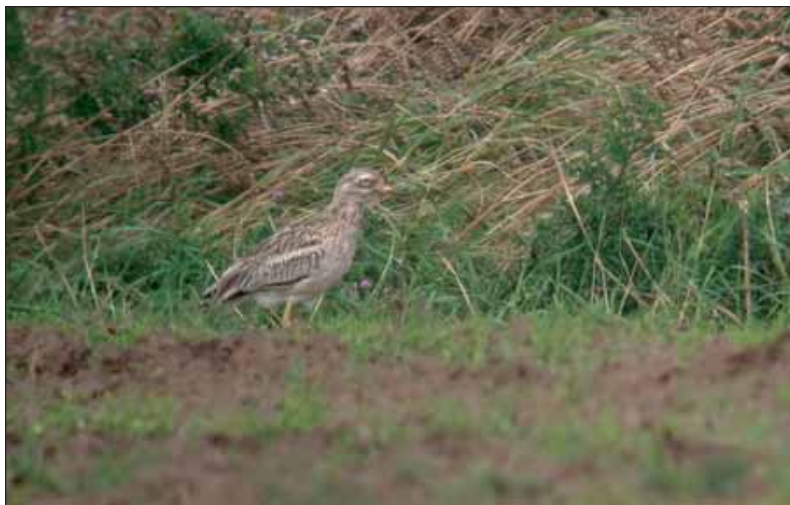
Griel Burhinus oedicnemus , Boneffe, 28 aug 2004

(117) 14 mei, Mol (A), Grote Zandput: 1 ad.