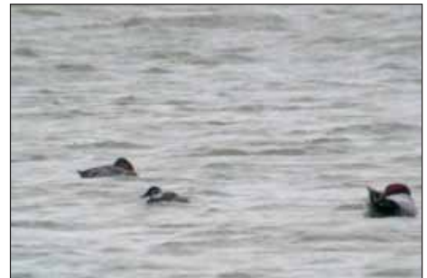
Witkopeend Oxyura leucocephala , Verrebroek, 20 maa 2004

(60) 20 januari, Geistingen (L), Houbenhof: 1 ex. (Opdenacker M.)