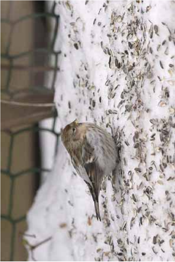
Foto 43: 'exilipes' – de eerder slordige flankstreping loopt hier vrij ver door