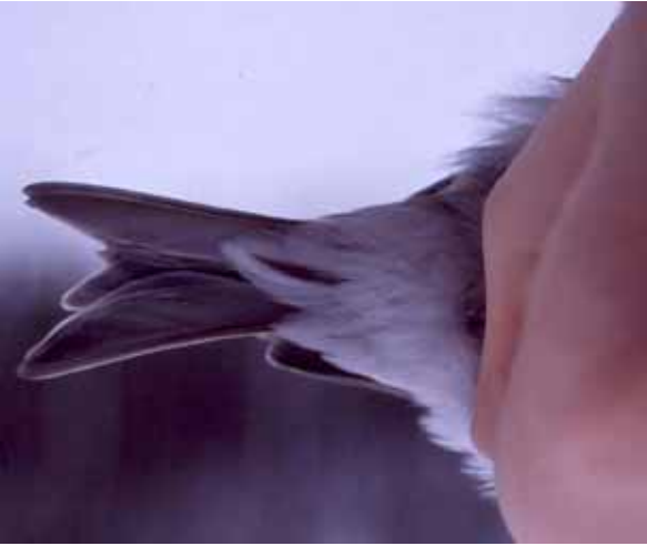
Foto 55: 'exilipes' – atypisch brede onderstaartdekveren hier