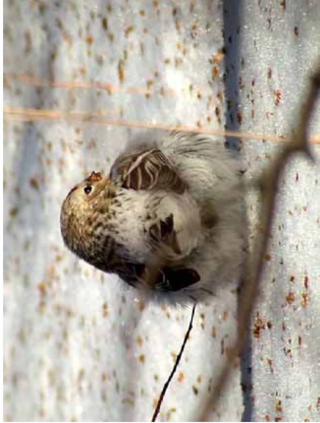
Foto 42: 'exilipes' – stuit kan gestreept zijn, bij dit exemplaar zou tegen het voorjaar dit nog meer tot uiting komen