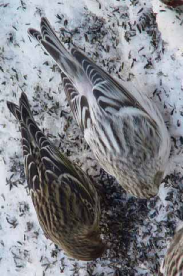
Foto 60: 'hornemanni' met 'flammea'