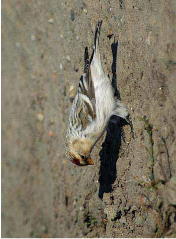
Foto 58: Micky Maher: 'hornemanni' – merk de bijna leeuwerikachtige vorm