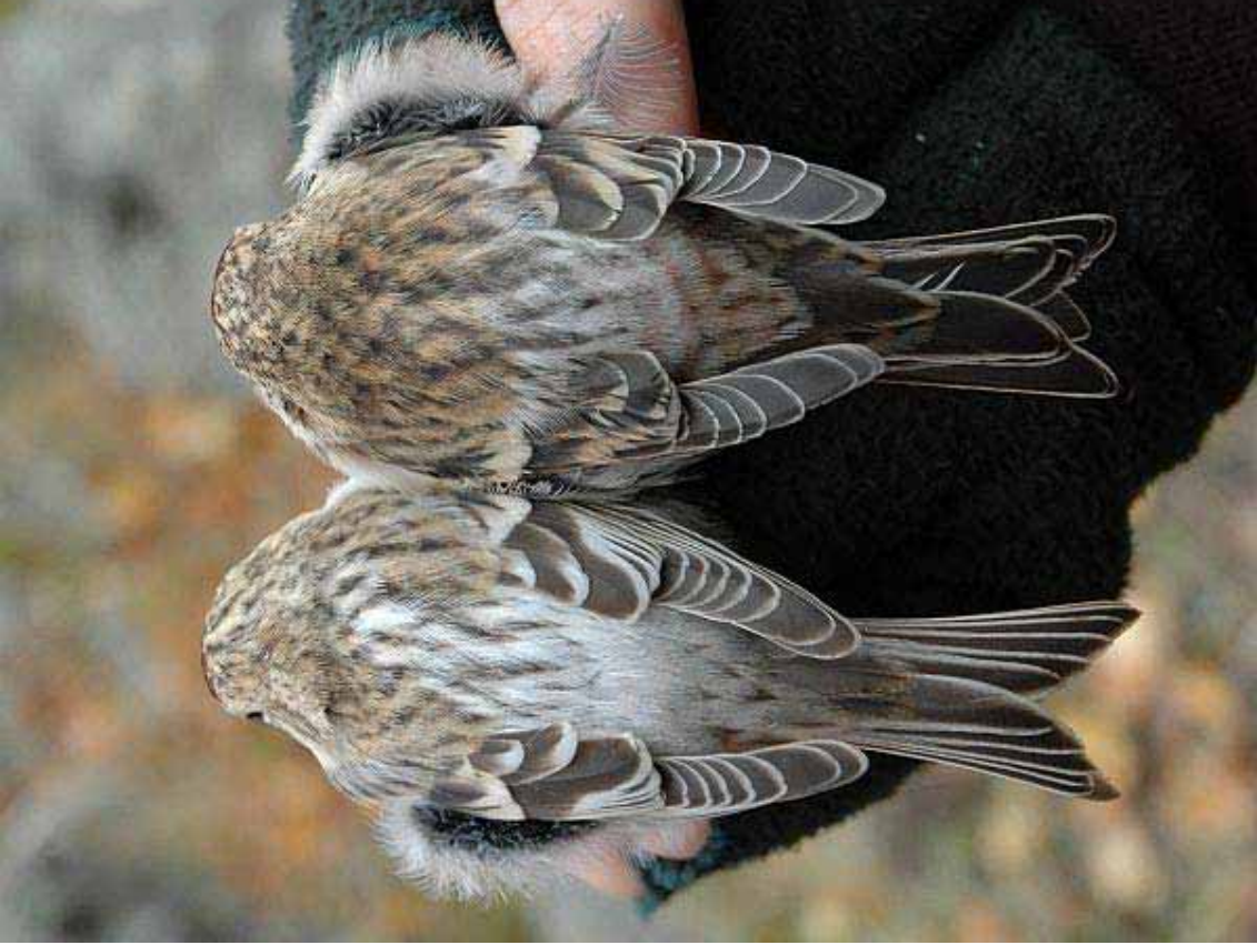
Foto 53: 'exilipes' en 'flammea' rechts, waarschijnlijk een adult (vrouwje?)