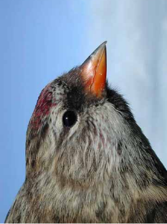
Foto 73: 'islandica' – merk convexe snavelvornn en