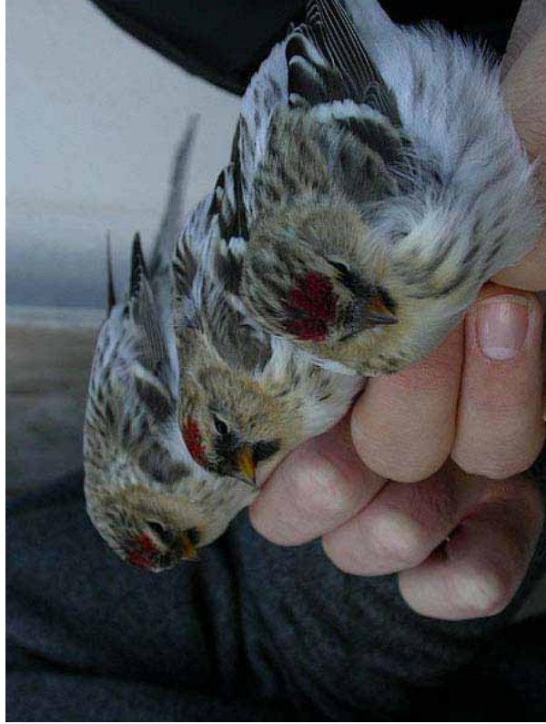
Foto 65: Per Inge Voernesbranden via website titran birdobservatory: 'hornemanni'