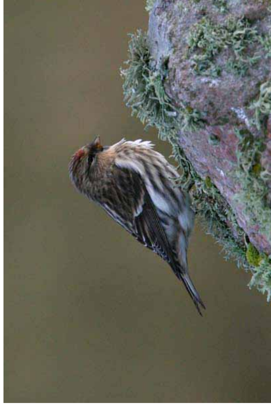
Foto 16: 'flammea' – ietwat donkerder exemplaar