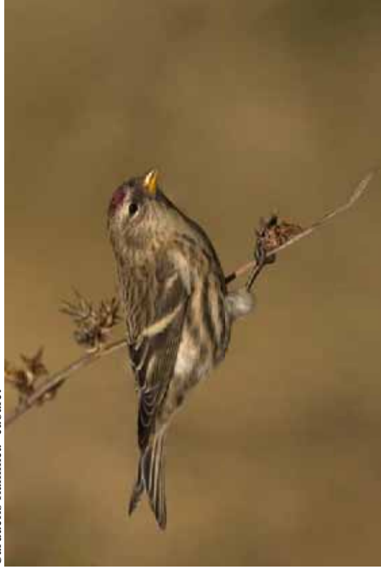
Foto 01: 'cabaret' – Typisch individu