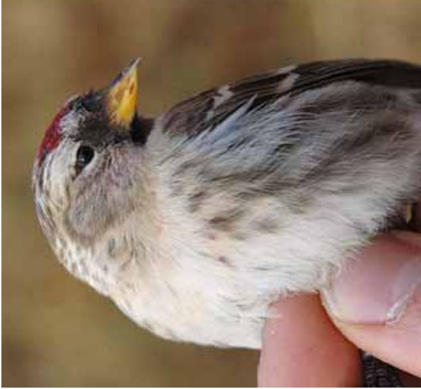
Foto 37: 'flammea' form holboellii