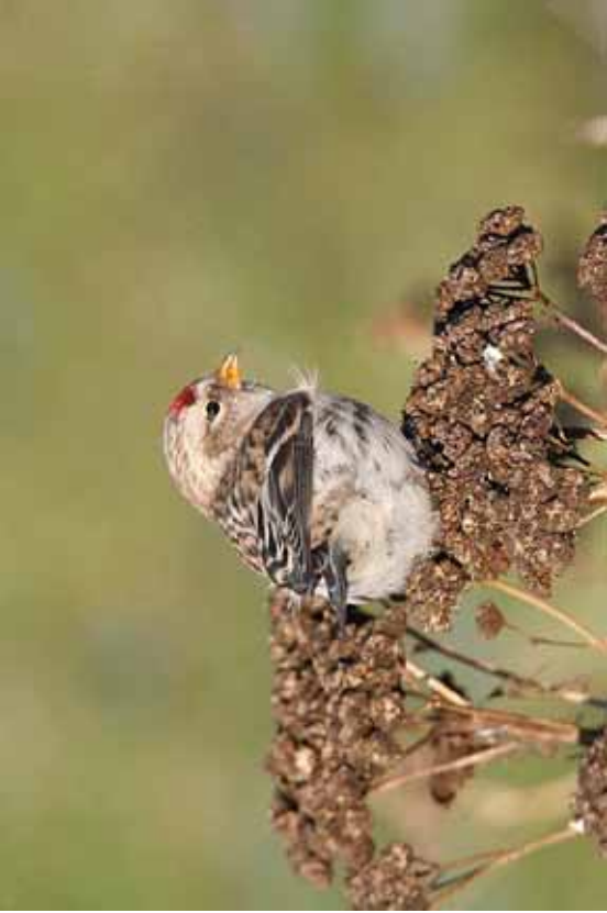
Foto 20: Jan Graakjaer Thomson, via netflug.dk: 'flammea' – een lichter exemplaar met lichte kop, maar wel ver doorlopende flankstreping