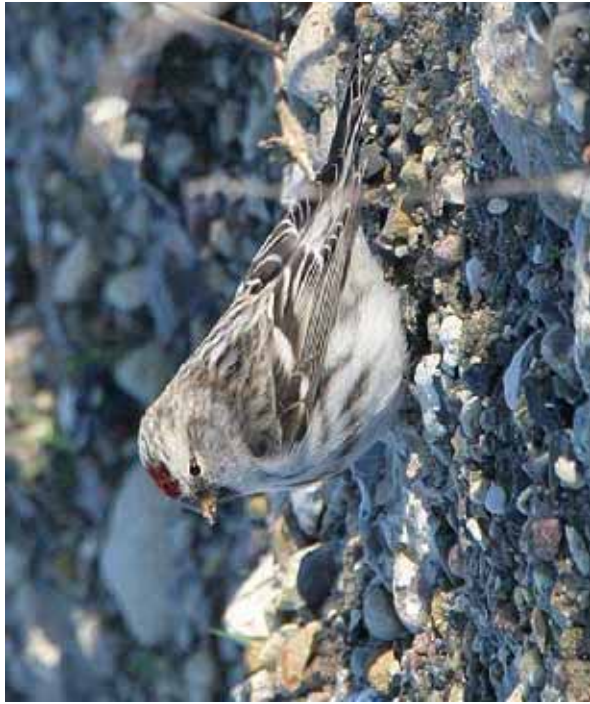
Foto 50: 'exilipes' – eerder zware flankstreping