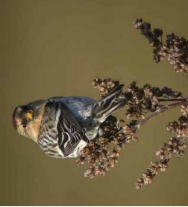
Foto 57: Micky Maher: 'hornemanni' – typische kopkleur, contrastierend met bovendelen, etc...