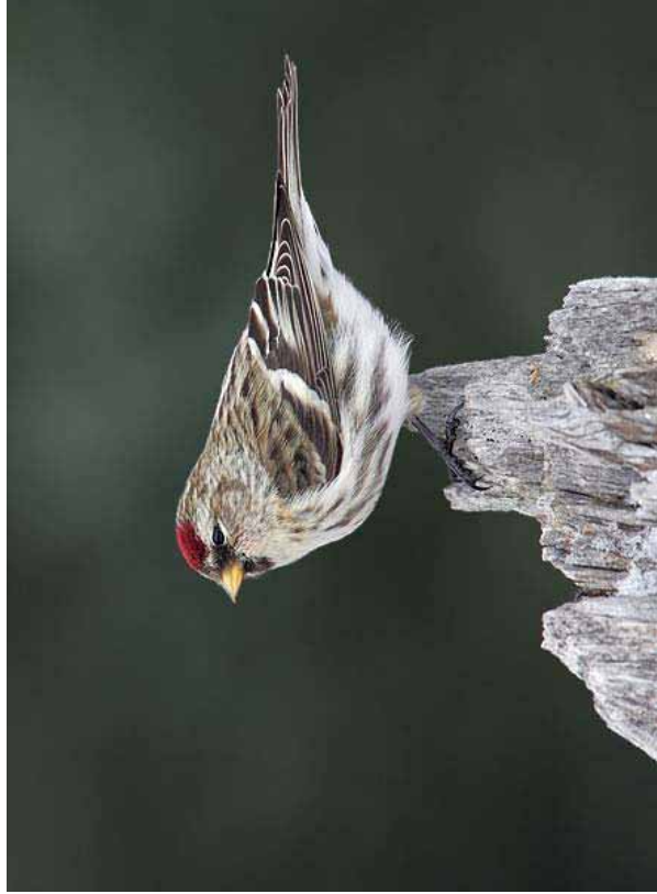
Foto 15: 'flammea' – gefotografeerd in Noord-Amerika