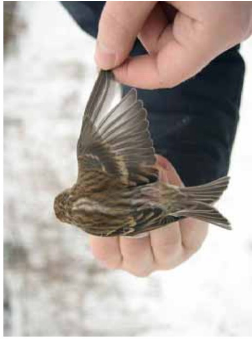
Foto 06: 'cabaret' – merk de zeemkleurige vleugelstrepen op