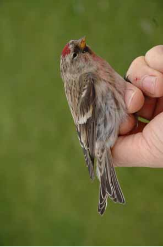
Foto 24: Miguel Demeulemeester: 'flammea' – adult mannetje in november