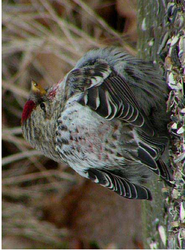
Foto 14: 'flammea' – merk de kleur van de bovenstaartdekveren