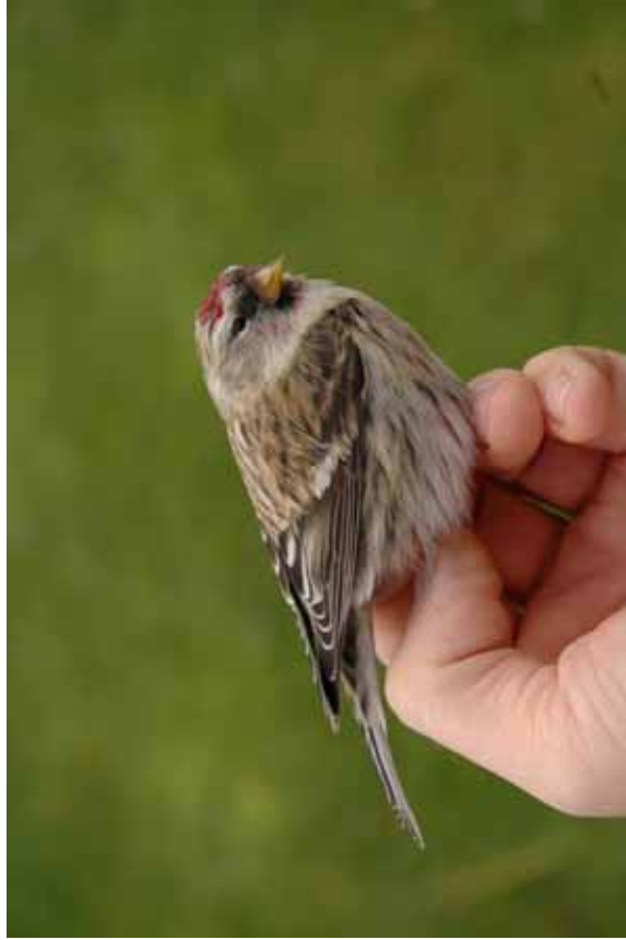
Foto 25: Miguel Demeulemeester: 'flammea' – een lichter 1 ste winter mannetje