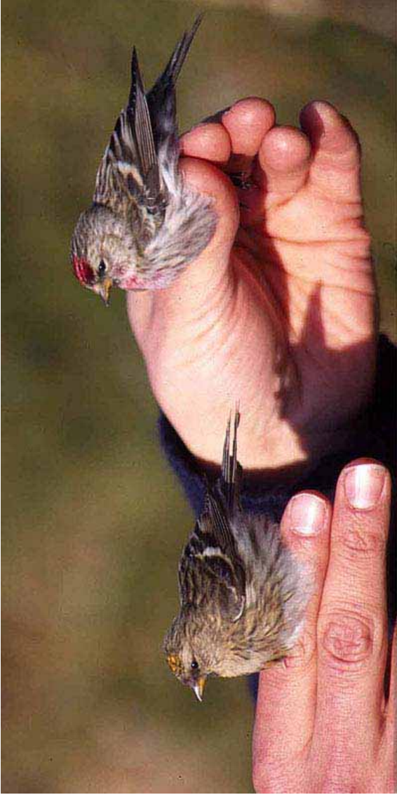
Foto 31: Aleksii Lehtikoinen, via tarsiger.com: 'flammea' – kleurafwijking met meer gelige voorhoofdsvlek