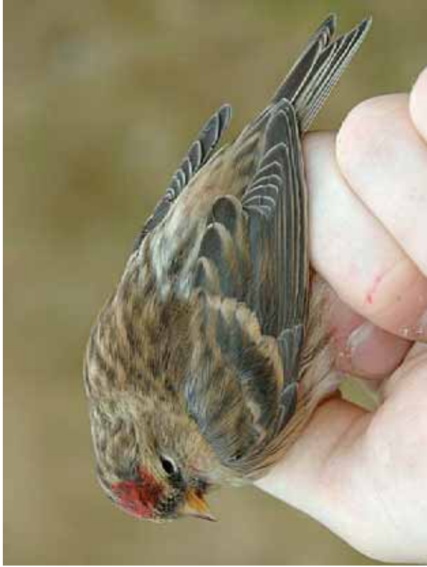
Foto 03: William Velmala, via tarsiger.com: 'cabaret' – 1 ste winter mannetje