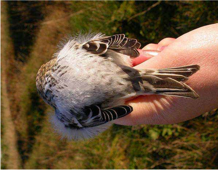
Foto 68: Beata E. via website titran birdobservatory: 'hornemanni' – merk ook patroon op bovenstaartdekveren