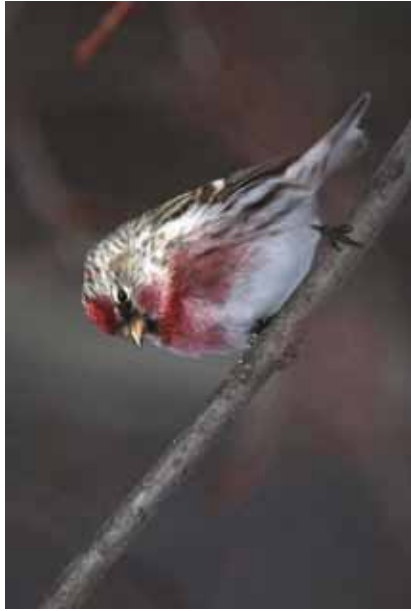
Foto 23: 'flammea' – zeldse opmerking hierboven