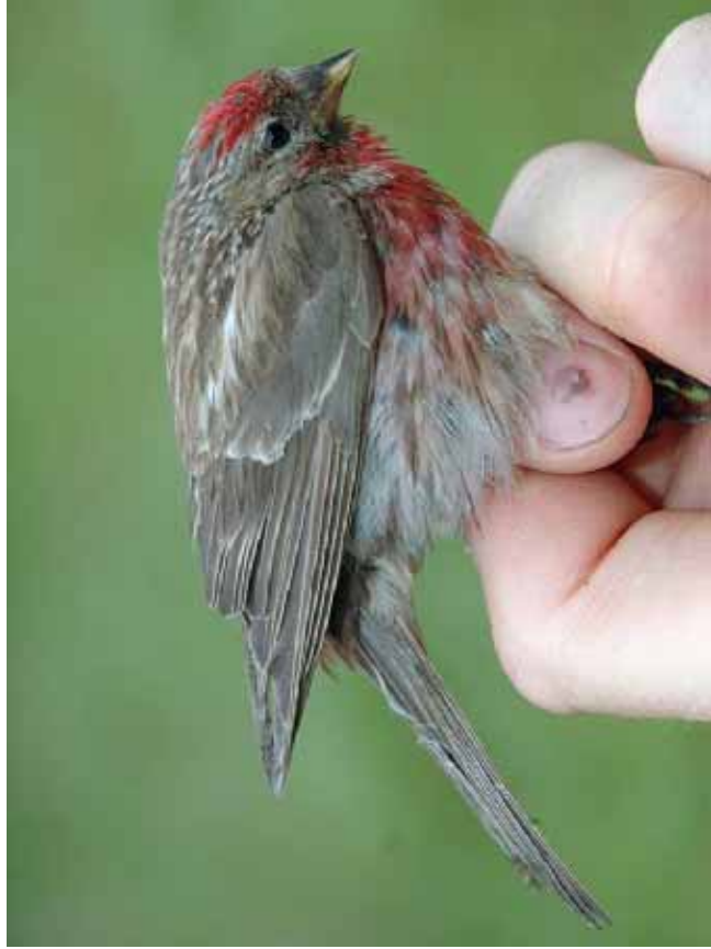
Foto 30: 'flammea' – in de zomer gefotografeerd, zeer gesleten mannetje