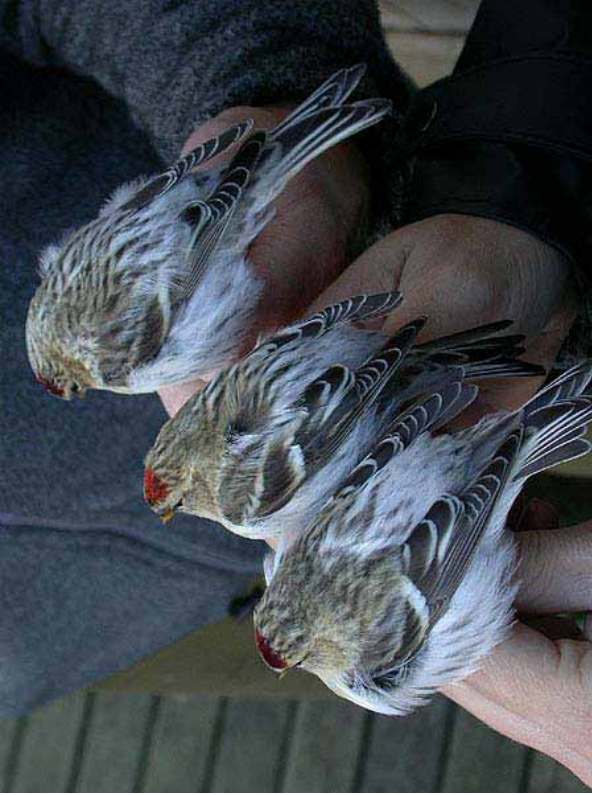
Foto 64: 'hornemanni' – alle drie 'hornemanni'