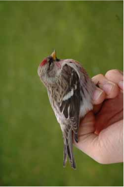
Foto 26: Miguel Demeulemeester: 'flammea' – een typisch exemplaar, zij het wat forse snavel misschien