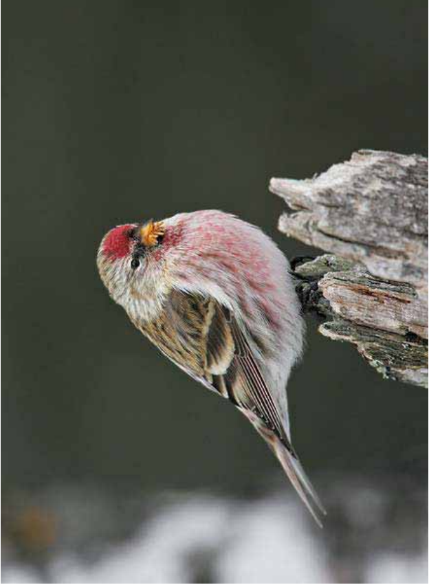
Foto 22: 'flammea' – naar voorjaar toe komt het rood op de borst door sleet veel feller