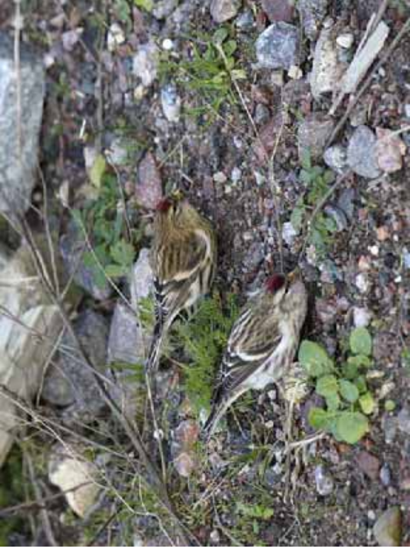
Foto 02: 'cabaret' – ietwat lichter individu samen met een lichtere 'flammea'