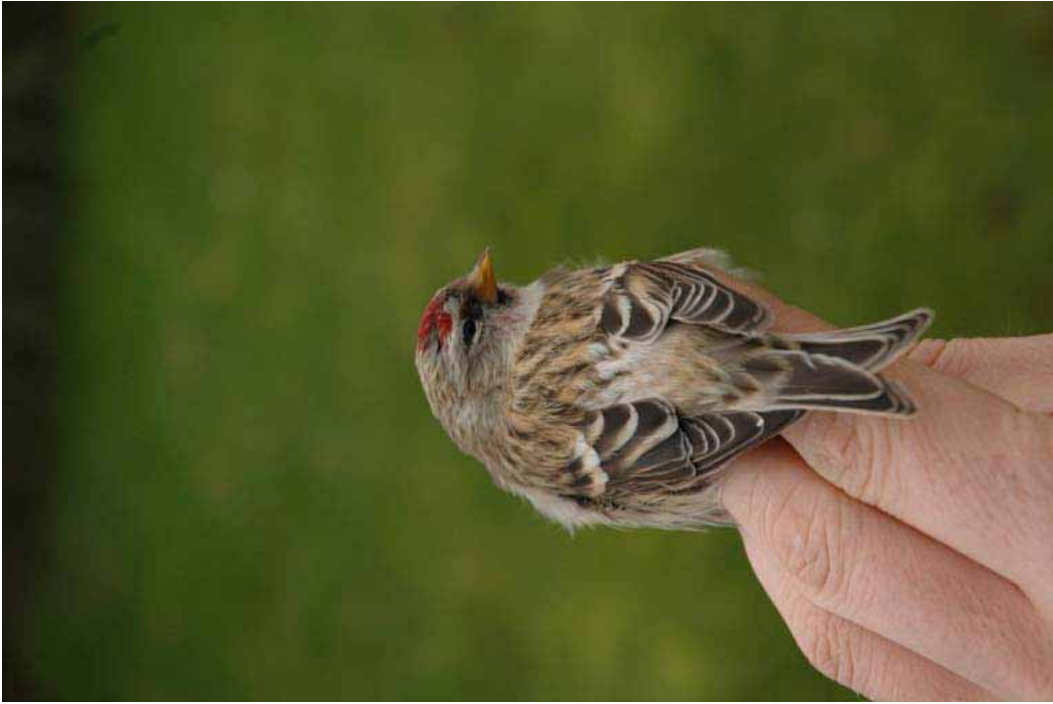
Foto 28: Miguel Demeulemeester: 'flammea' – het lichtere exemplaar, merk de buffy stuit