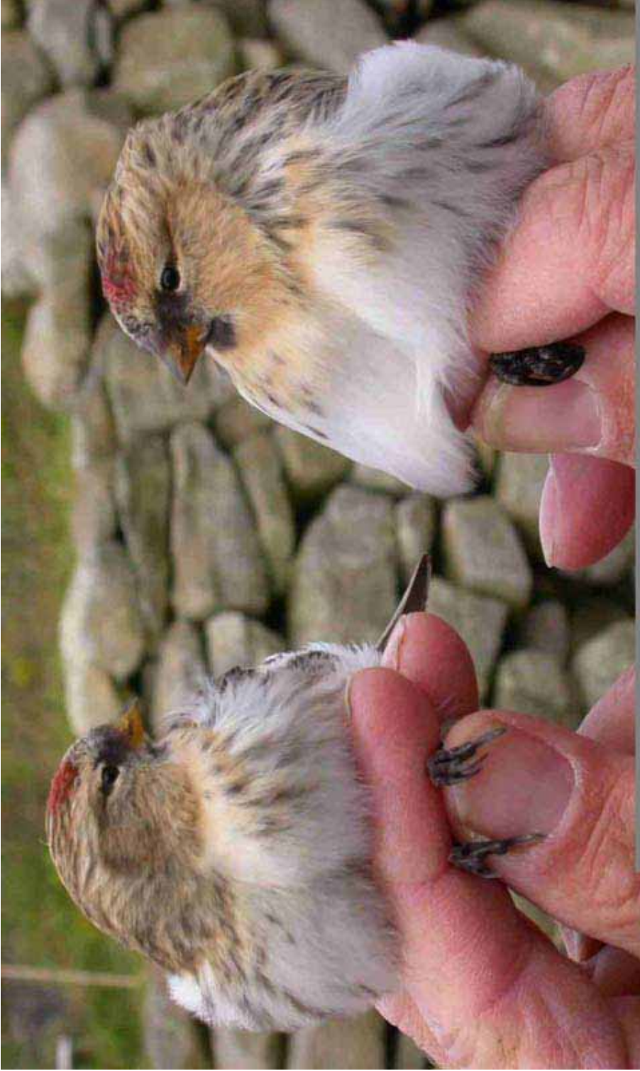
Foto 63: 'hormemanni' rechts naast een 'flammea'