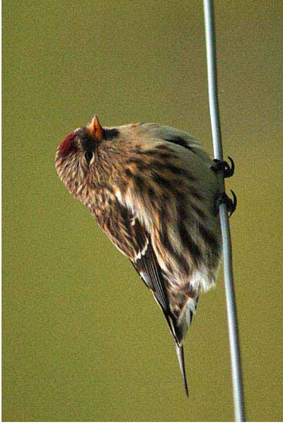
Foto 69: Rebecca Nason, via fairislebirdobs.co.uk: 'rostrata' – typisch individu