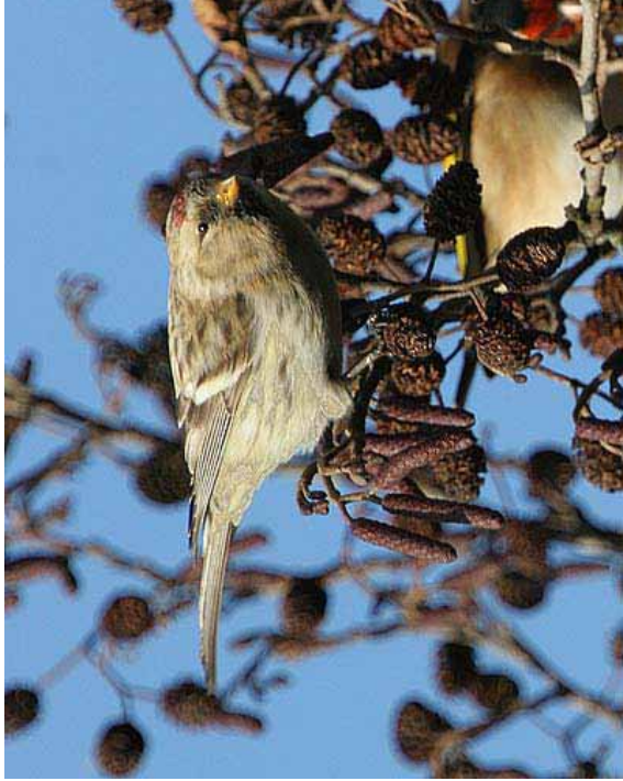
Foto 48: 'exilipes' – brede vrijwel evenwijdig blijvende witte vleugelstreep