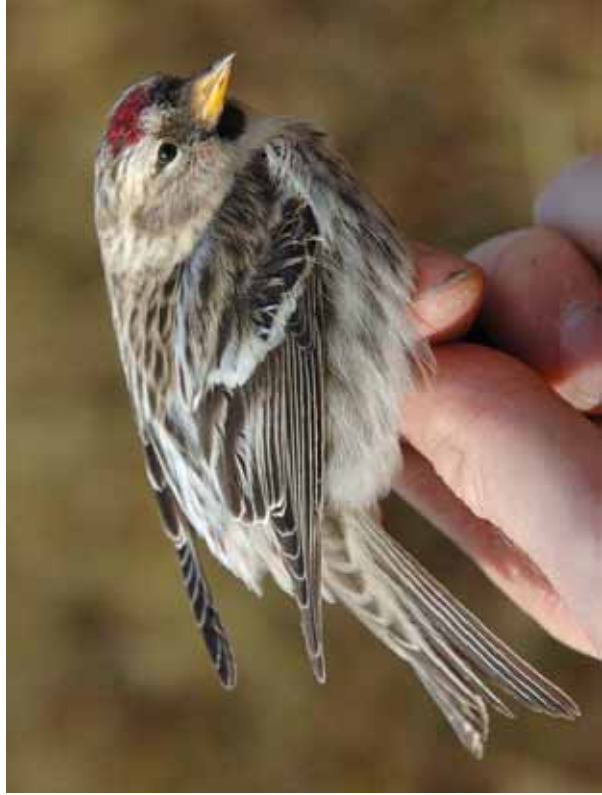
Foto 38: 'flammea' form holboellii