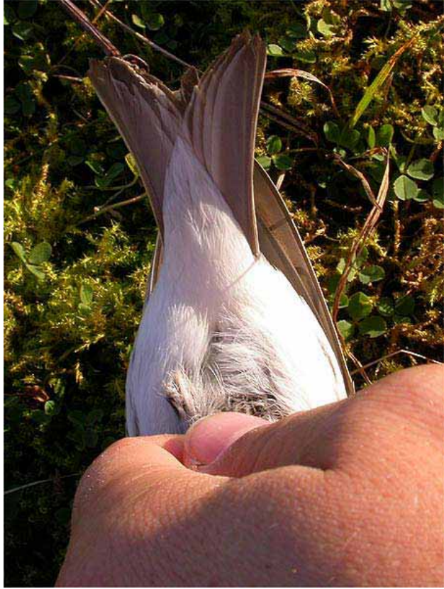
Foto 67: 'hormemanni' – spierwitte onderstaartdekveren