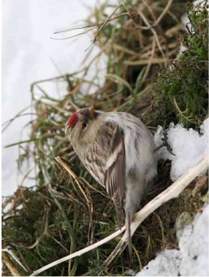
Foto 46: 'exilipes' – let op de 'ingedeukte' kopvorm