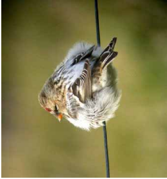
Foto 40: 'exilipes' – merk het steil oplopende voorhoofd van dit typisch exemplaar