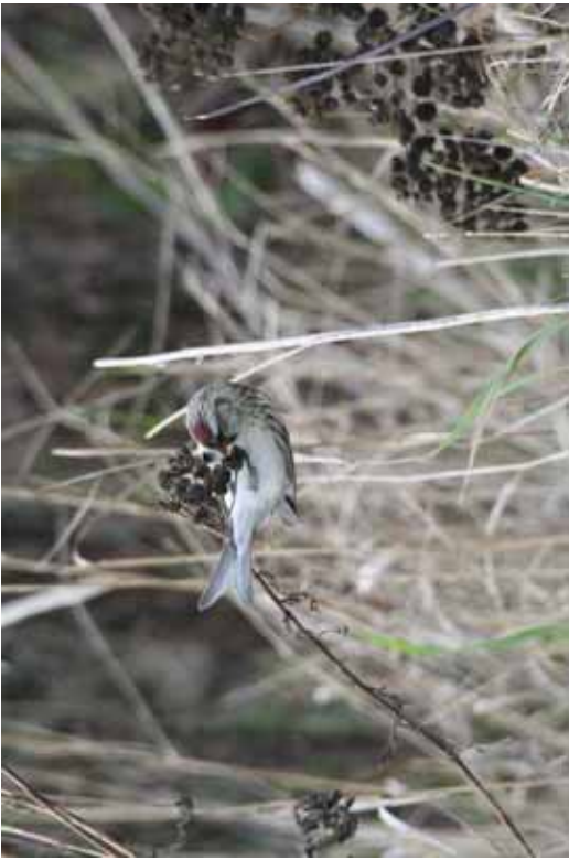
Foto 45: Jan Graakjaer Thomson, via netfugl.dk: 'exilipes' – heel weinig zwart op de langste onderstaardekveer