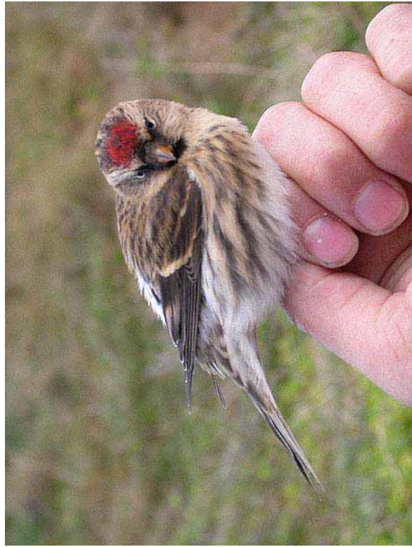
Foto 71: 'rostrata' – een lichtere vogel