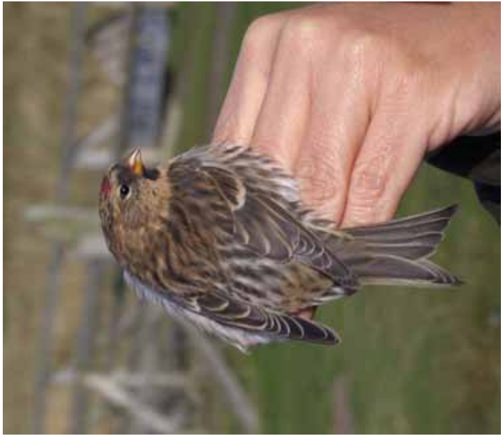
Foto 70: Micky Maher: 'rostrata' – merk donker en zwaar gestreepte stuit en mantel