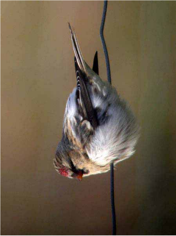
Foto 41: Deryk Shaw, via fairislebirdobs.co.uk : 'exilipes' – merk de omvang van de witte stuitvlek