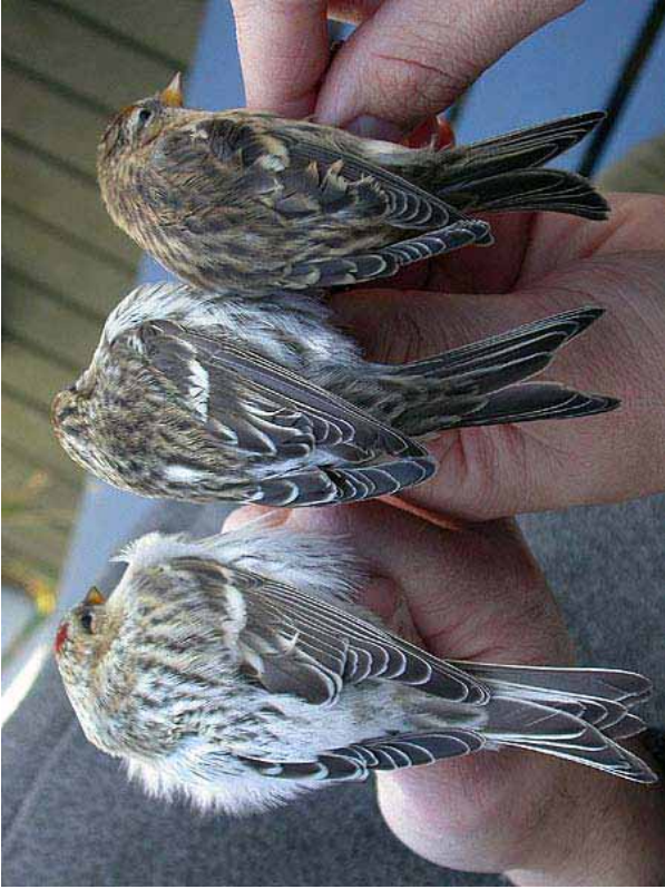
Foto 66: 'hormemanni' met 'flammea' midden en 'cabaret' rechts