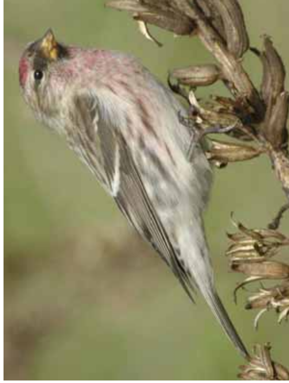
Foto 13: Norman D. van Swelm: 'flammea' – ietwat meer 'uitgevassen' met de typische stordige flankstreping