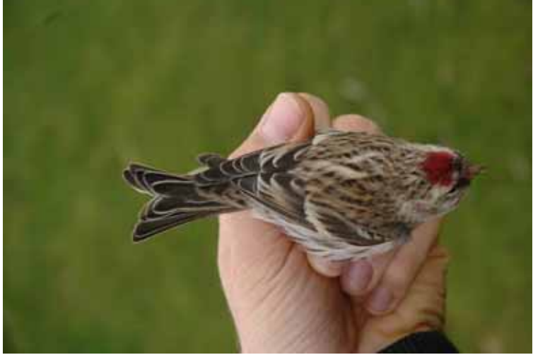
Foto 27: Miguel Demeulemeester: 'flammea' – zelfde adulte mannetje