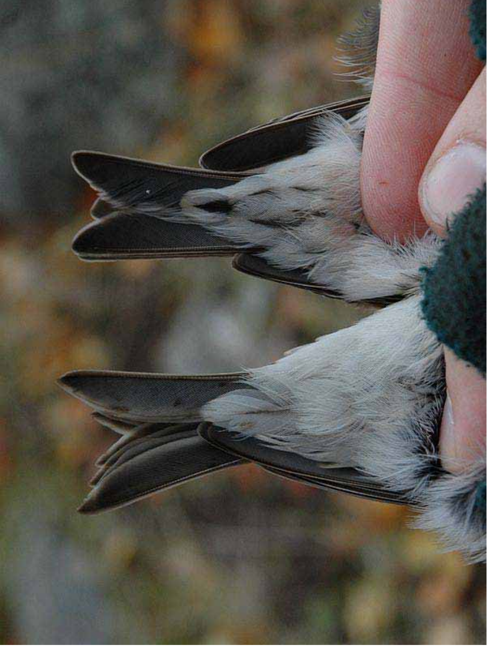
Foto 54: Sampo Kunttu, via tarsiger.com: 'exilipes' en 'flammea' rechts – mooi voorbeeld van de onderstaartdekveren