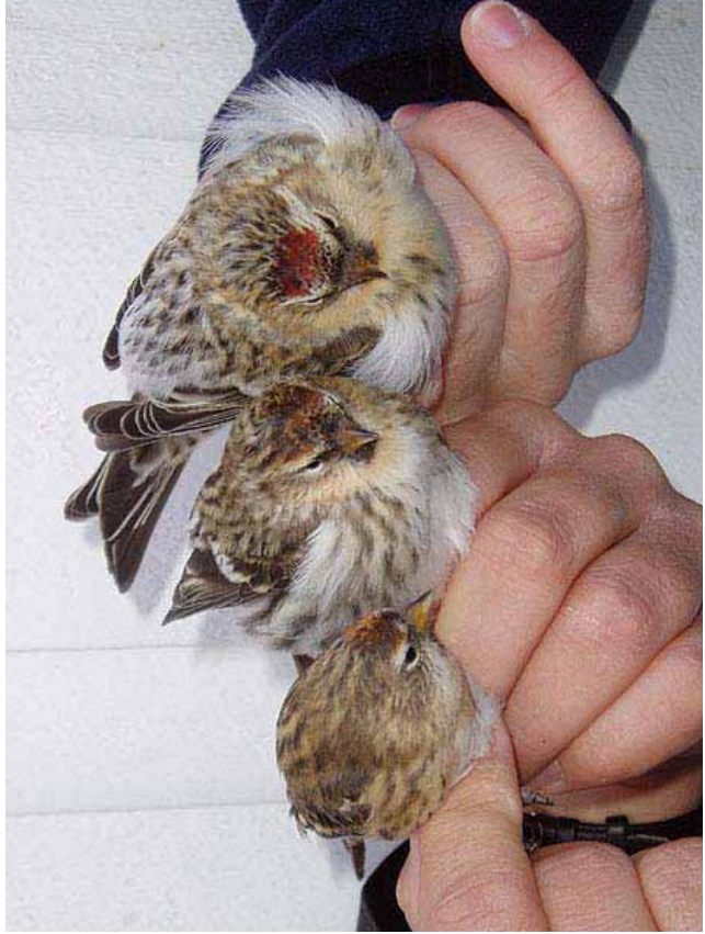
Foto 32: 'flammea' – hier samen met 'cabaret' links en 'hornemanni' rechts