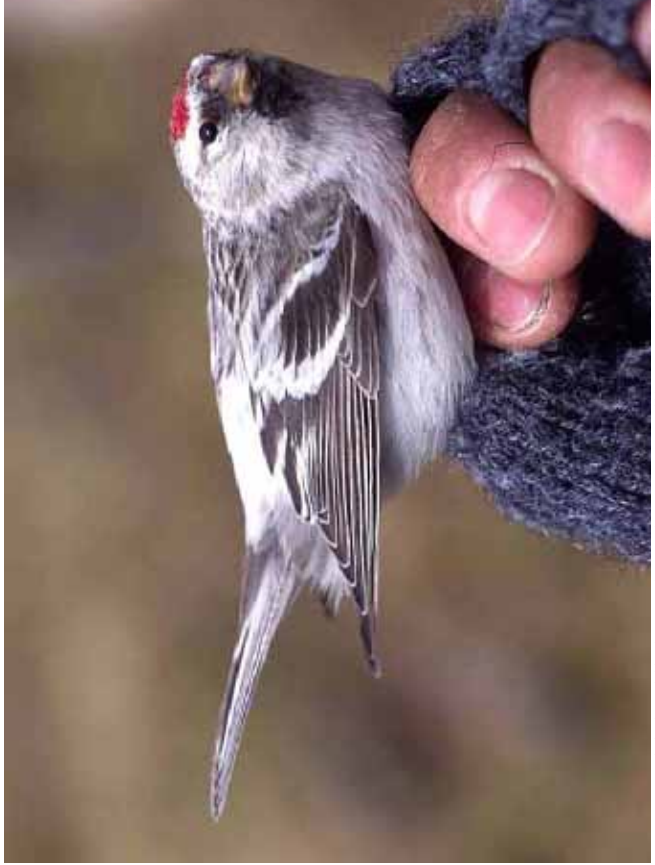
Foto 56: 'exilipes' – gesleten individu, foto genomen in het voorjaar, roze op borst begint door sleet zichtbaar te worden