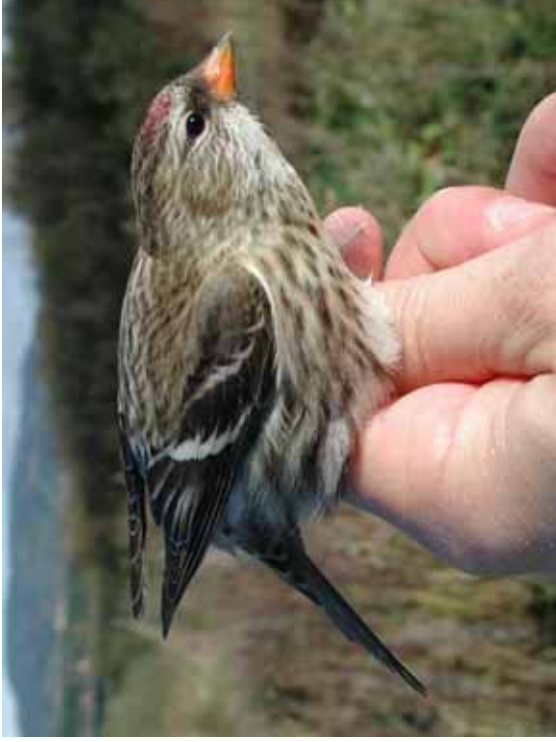
Foto 71: Halvor Sørhuus, via nofnt.no: 'islandica' – twijfel over dit individu, maar is de best passende reeks foto's die ik vond