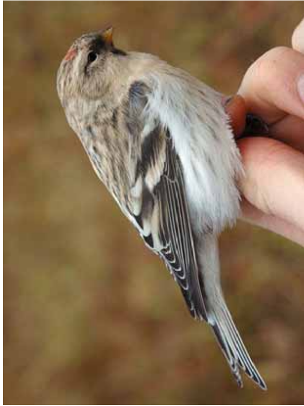
Foto 52: 'exilipes' – kopvorm!