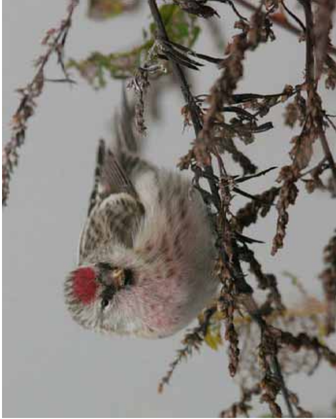
Foto 21: 'flammea' – weinig flankstreping op dit grijsig individu